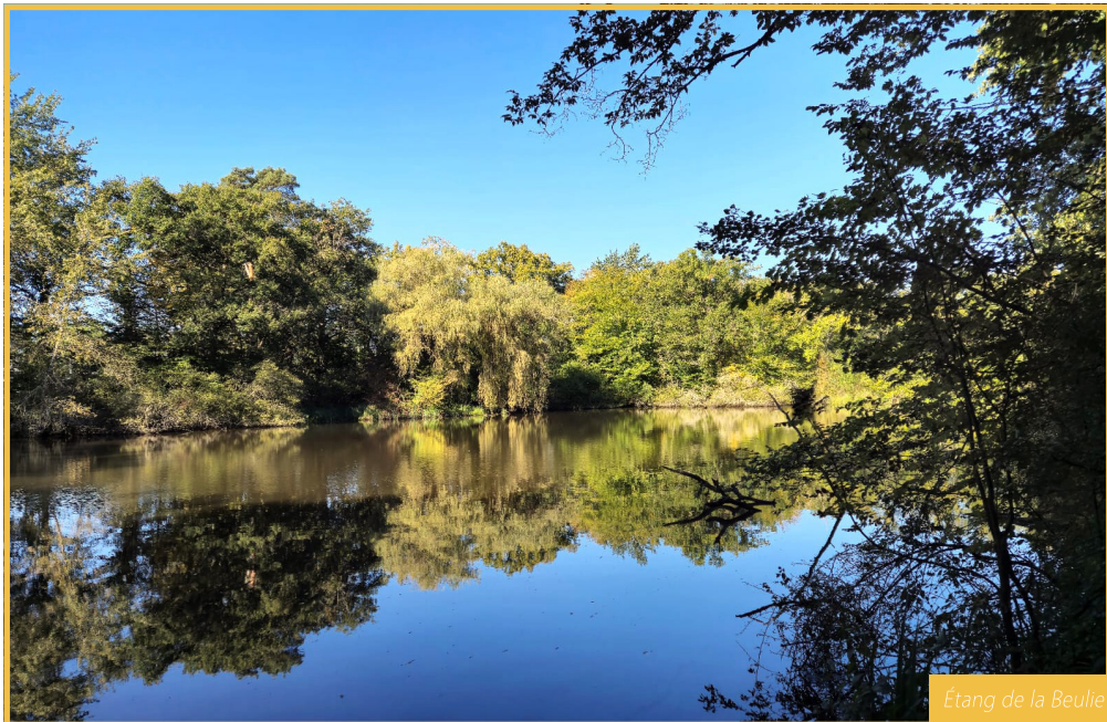
Étang de la Beulie

C'est un superbe étang sauvage qui appartient à la commune et à la société Merck. Si vous êtes discret, vous pourrez découvrir canards, hérons, foulques, etc. L'inventaire de la biodiversité communale, réalisé par Loiret Nature Environnement en 2016/2017 a détecté la présence de tritons marbrés, de tritons alpestres et de quelques 68 espèces d'oiseaux différents dont des rapaces.