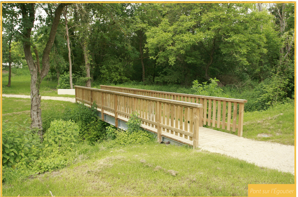
Pont sur l'Égoutier