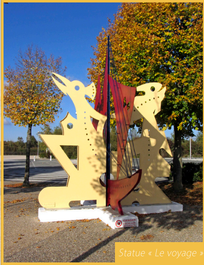
Statue « Le voyage »