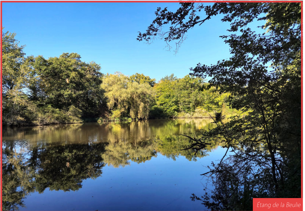
Étang de la Beulie

C'est un superbe étang sauvage qui appartient à la commune et à la société Merck. Si vous êtes discret, vous pourrez découvrir canards, hérons, foulques, etc. L'inventaire de la biodiversité communale, réalisé par Loiret Nature Environnement en 2016/2017 a détecté la présence de tritons marbrés, de tritons alpestres et de quelques 68 espèces d'oiseaux différents dont des rapaces.